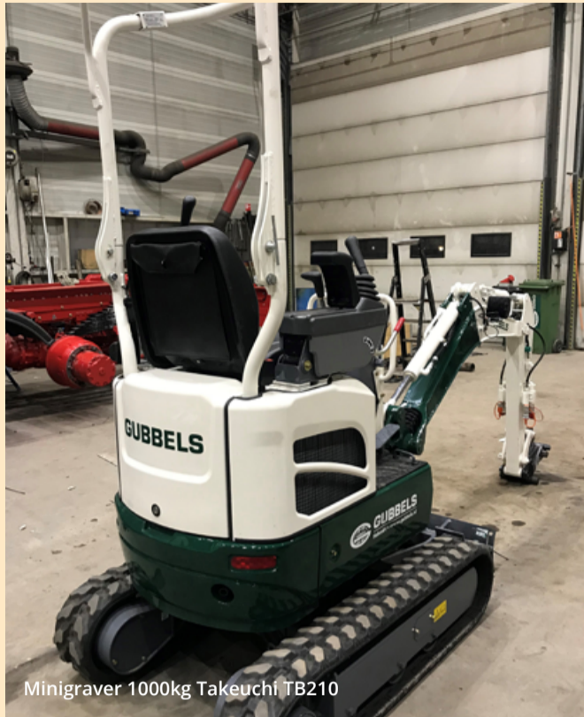
Minigraver 1000kg Takeuchi TB210