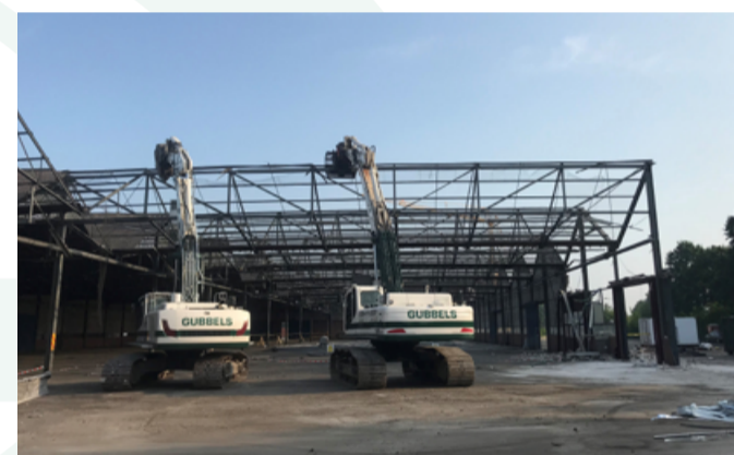
The Greenery Breda SLOOP / ASBESTSANERING

Het project betreft het inrichten van de voormalige rondweg nabij Steenbergen, die door de aanleg van de nieuwe A4, een andere functie heeft gekregen. Een omvangrijk project waar alle verschillende disciplines van de Gubbels Bedrijven weer hun steentje bij kunnen dragen. Zo worden door Gubbels Infra en Milieu o.a. de bestaande betonverharding gezaagd en opgebroken, de bestaande teerkalkfundering gesaneerd, verontreinigde grond uit de bermen gesaneerd, cunetten en watergangen gegraven en puinfundaties aangelegd. Dochteronderneming BBC breekt een gedeelte van de vrijkomende betonverharding ter plaatse voor hergebruik in het project en het restant van het betonpuin wordt op onze locatie TOP de Kragge in Bergen Op Zoom gebroken, gezeefd en gewassen om deze weer als hoogwaardige grondstof te leveren aan de verschillende betonproducenten. Door GRzN wordt de afzet en acceptatie van alle vrijkomend teerkalkstabilisatie en verontreinigde grond verzorgd, alsmede de verschillende leveranties van zand en grond vanuit TOP de Kragge. Zo zorgt de synergie tussen de verschillende Gubbels Bedrijven ervoor dat wij als partner een perfecte rol kunnen vervullen bij het uitvoeren van dergelijke projecten !