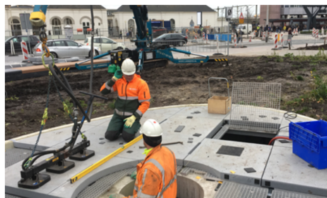
Leeuwarden Stationsplein SPECIAL

Projectlocatie: 's-Hertogenbosch Balkweg e.o. Project: Terreininrichting Retailpark Uitvoering: Gubbels Infra en Milieu B.V. Status: in uitvoering