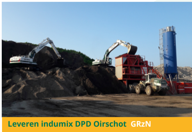
Leveren indumix DPD Oirschot GRzN