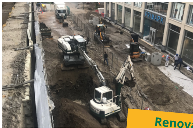
Renovatie sloop Stads Kantoor 1 Tilburg