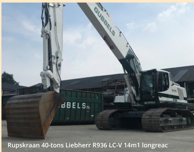
Rupskraan 40-tons Liebherr R936 LC-V 14m1 longreac