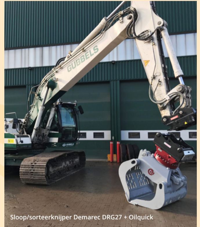
Sloop/sorteerknijper Demarec DRG27 + Oilquick