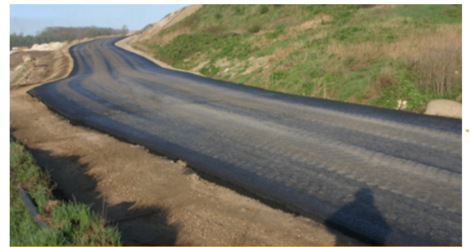
Toepassing indumix® stortplaats Attero Landgraaf

In Tilburg aan de Watermansstraat is het veevoederbedrijf Verdij Specialty Feed gevestigd. Dit bedrijf produceert hoogwaardige speciale diervoeders. Een stalen bulksilo was door veranderde productiemethodes overbodig geraakt en aan Gubbels Sloop en Asbestsanering BV was de opdracht gegeven deze silo deskundig te verwijderen. De hoogte van 30 meter en de silo in staal uitgevoerd maakte het voor de machinist een uitdagende klus. Met onze high reach sloopkraan en schroetschaar hebben onze vakmensen de silo stukje bij beetje weg geknipt en vervolgens afgevoerd.