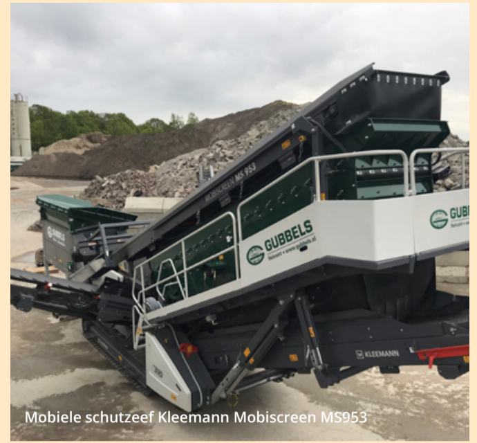
Mobiele schutzeef Kleemann Mobiscreen MS953