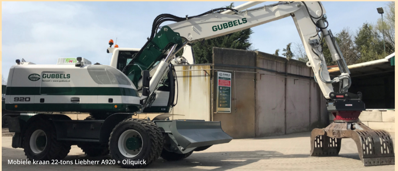
Mobiele kraan 22-tons Liebherr A920 + Oliquick