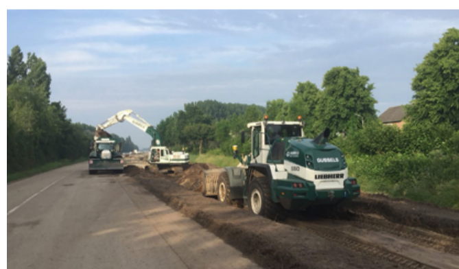
Rondweg Oost Steenbergen INFRA / MILIEU

Projectlocatie: Reconstructie Rondweg Oost te Steenbergen Project: Reconstructie rondweg oost Uitvoering: Gubbels infra en Milieu B.V. Status: Gereed eind juli