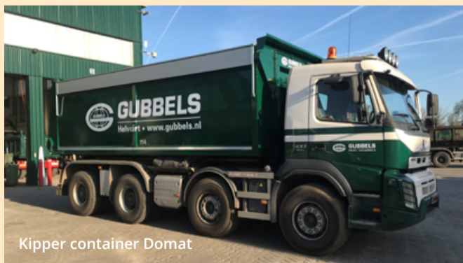
Kipper container Domat