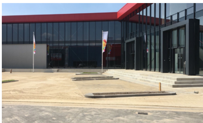
's-Hertogenbosch Balkweg INFRA / MILIEU