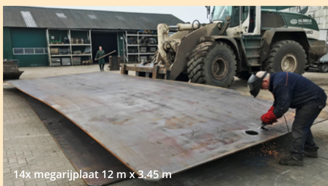
14x megarijplaat 12 m x 3.45 m