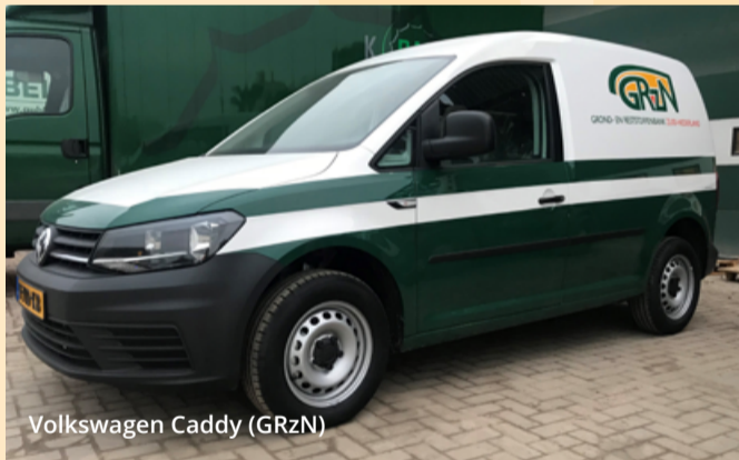
Volkswagen Caddy (GRzN)