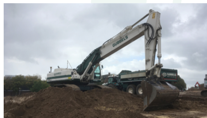
Grondverzet plan Belvedere INFRA / MILIEU

Een leuke uitdaging met hoogteverschillen, trappen, mindervalide helling en bijpassende groenvoorzieningen. Momenteel zijn we doende met de ondergrondse werkzaamheden zoals fundering, koppensnellen, riolering etc. in een volgende nieuwsbrief meer hierover.