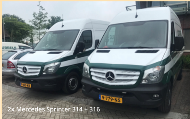
2x Mercedes Sprinter 314 + 316