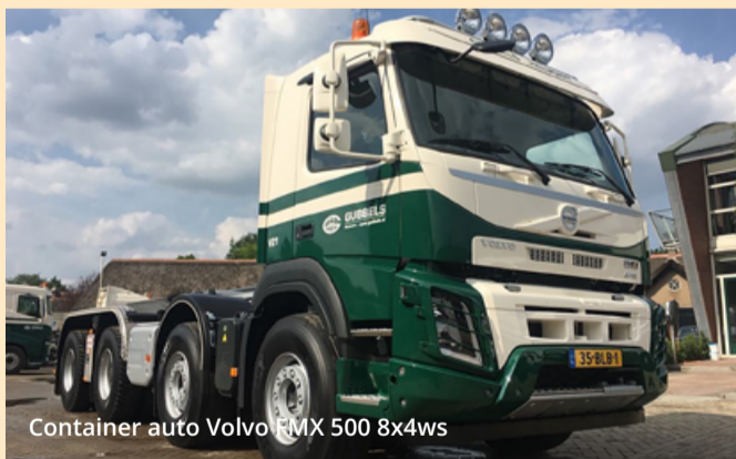
Container auto Volvo FMX 500 8x4ws